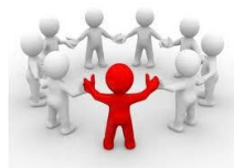
Mērķu un taktikas apspriešana