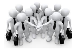
Veiksmīgāka un spēcīgāka komanda uz 2012.gada starta līnijas